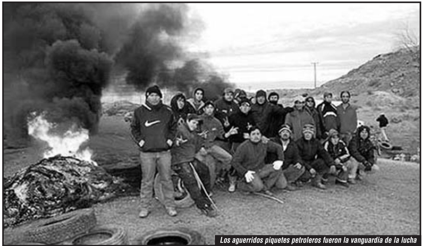
Los aguerridos piquetes petroleros fueron la vanguardia de la lucha

propias fuerzas y organizarse de forma independiente. La verdadera normalización del sindicato al servicio de nuestros intereses vendrá votando delegados con mandato de base revocable, donde los 140 delegados vuelvan a revalidarse en asambleas en los pozos. ¡Conquistemos un cuerpo de delegados de base con mandato revocable, que cobren la cuota sindical en cada pozo y yacimiento y que ponga el sindicato al servicio de reagrupar las filas obreras! ¡Para derrotar a la dictadura de las petroleras debemos unirnos desde Tierra del Fuego a Mosconi para enfrentar el ataque que los monopolios y los partidos patronales nos han largado! ¡Comencemos ya mismo por salir a luchar junto a los trabajadores docentes! ¡Que las corrientes de izquierda y sus delegados petroleros se pongan al servicio de unificar a los que luchan!