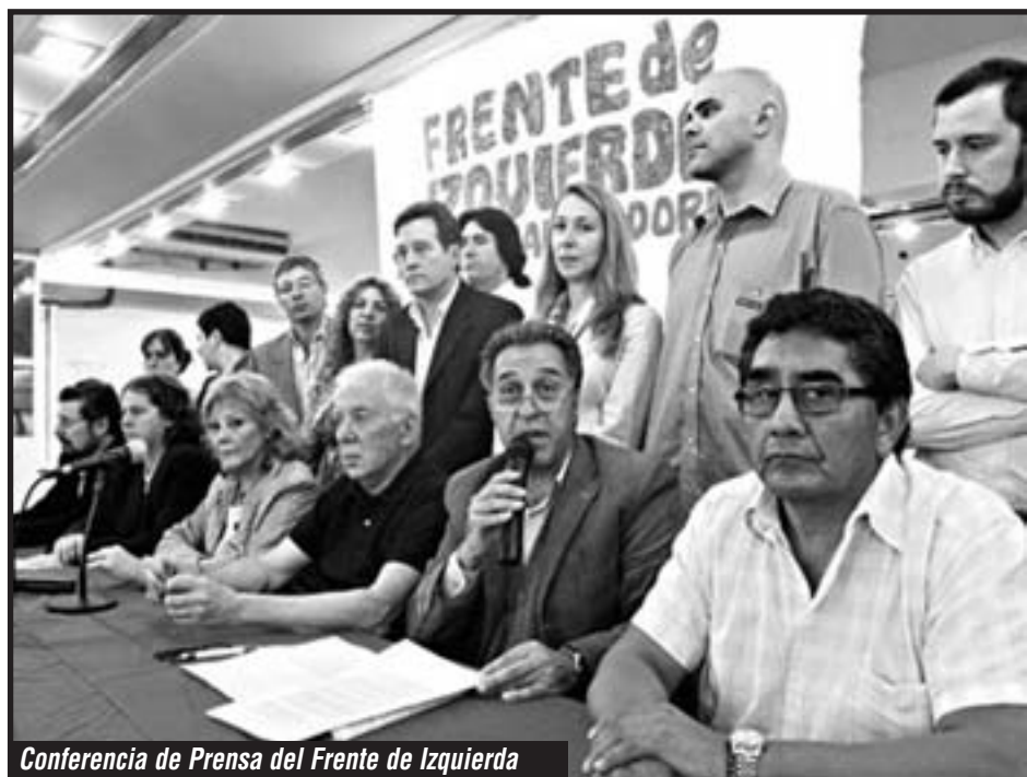
Conferencia de Prensa del Frente de Izquierda