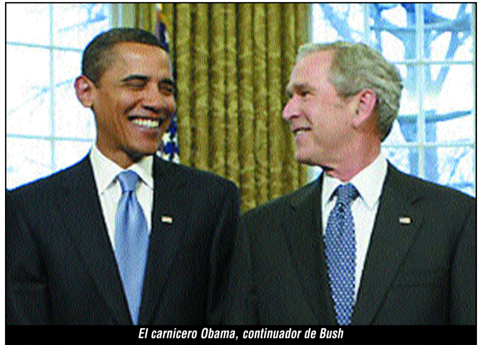
El carnicero Obama, continuador de Bush

Una cortina de humo para esconder el pacto de Obama con las burguesías nativas del Talibán y Pakistán para que éstos le cubran sus espaldas en su retirada de Afganistán