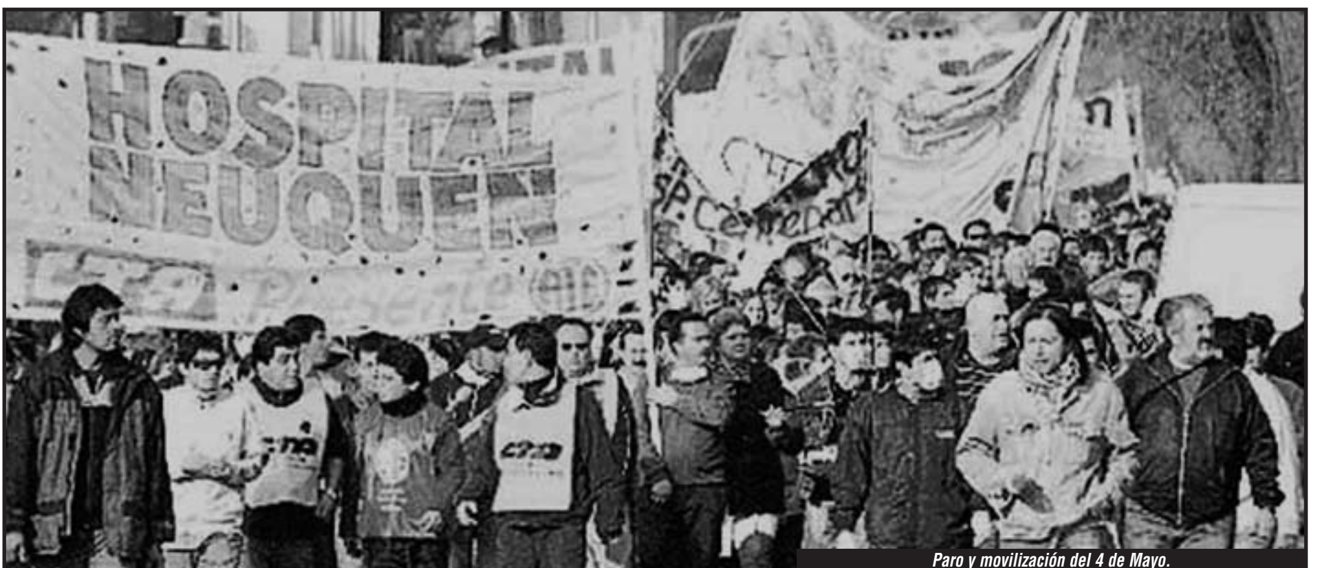
Paro y movilización del 4 de Mayo.