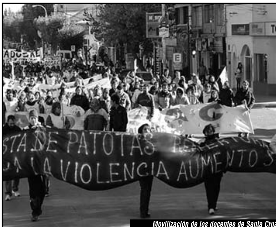
Movilización de los docentes de Santa Cruz

¡Las listas de oposición de la CTERA en todo el país, desde todas las seccionales que dirigen e influyen, todas las seccionales en manos de la Azul y Blanca (PCR/CCC) y demás corrientes de oposición como las del Suteba La Plata "Legítimo", Ademys, AGD-Uba, Suteba Escobar, la "minoría" del Suteba Matanza, "minoría" del Suteba San Martín-Tres de Febrero, congresales provinciales de Suteba de General Sarmiento, Lomas de Zamora, La Plata, Matanza, Tigre, Esteban Echeverría, Florencio Varela, Quilmes, Merlo, Moreno, Hurlingham, Morón, etc., como así también desde ATEN en Neuquén, desde AMSAFE, y del resto del país, no deben esperar un minuto más y deben ¡PARAR YA! y llamar a rodear la CTERA/CTA en Capital Federal para imponerle a la burocracia carnera ¡el Paro Nacional ya! ¡Esta es la moción de soli-